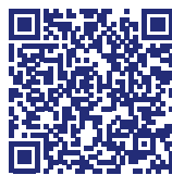
Für Android (Google Play Store)